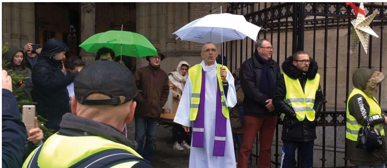
Les évêques invitent les chrétiens à faciliter le dialogue (lire page 7)